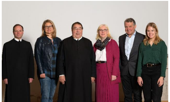
Hausteam von Mülln