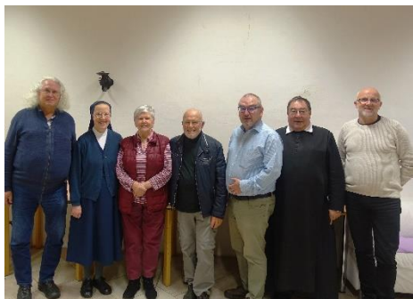
Vinzenz Gemeinschaft Mülln

Bitte sagen sie es weiter, dass sich Menschen in Notsituationen an „ArMut teilen“ wenden können (0662/8047-806616) und bitte spenden sie, wenn sie diese Form des Teilens unterstützen möchten: