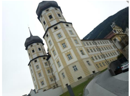
Einige Eindrücke in Bildern

Nächster Termin, wenn es mein neuer Chef zulässt, 30. September 2023, Näheres im nächsten Pfarrbrief.